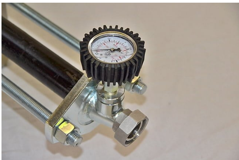
06600g – Kit raccordo con manometro 40 bar