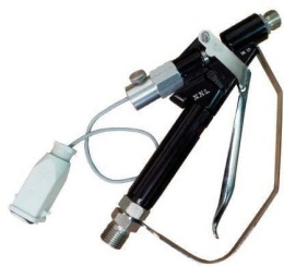
078600E – pistola airless XXL-E electric switch