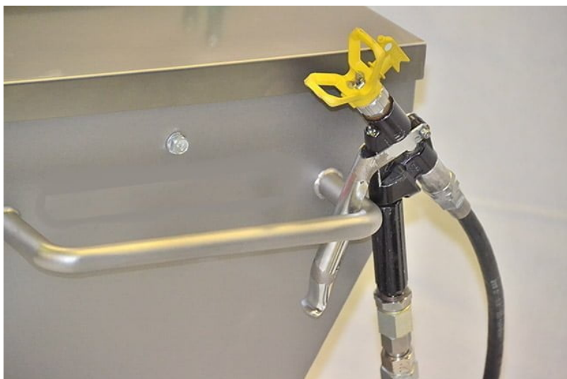
076800E – pistola airless XXL-E electric switch