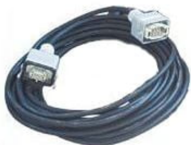
017801 – kit cavo elettrico per comando remoto