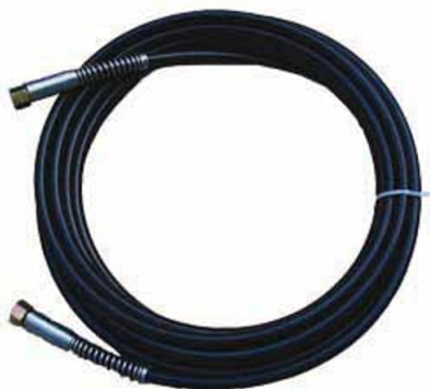
060030 – kit tubo alta pressione \varnothing 10 mm, lunghezza 10 m.