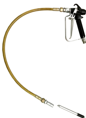
077400 pistola airless + 060017 kit iniezione (50 cm)